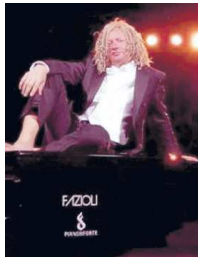
Maurizio Mastrini e Alessandro Haber stasera sul palco

Con questa ambientazione, del tutto originale, l'attore e regista Alessandro Haber e il direttore artistico del festival Maurizio Mastrini si esibiranno in un suggestivo spettacolo in grado di unire voce e pianoforte con uno stile unico e innovativo. Una sorta di sperimentazione dove il pianista e compositore Mastrini riuscirà a fondere la versatilità di un grande talento