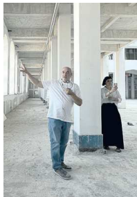
Alcuni momenti della presentazione del progetto ieri al Mercato coperto. Previsi dieci mesi di lavori